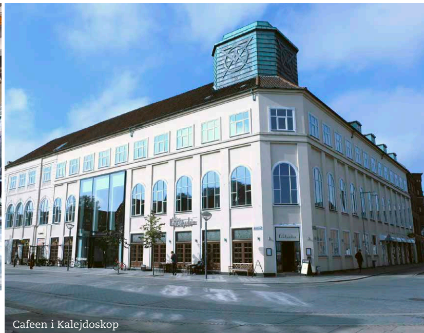
Cafeen i Kalejdoskop